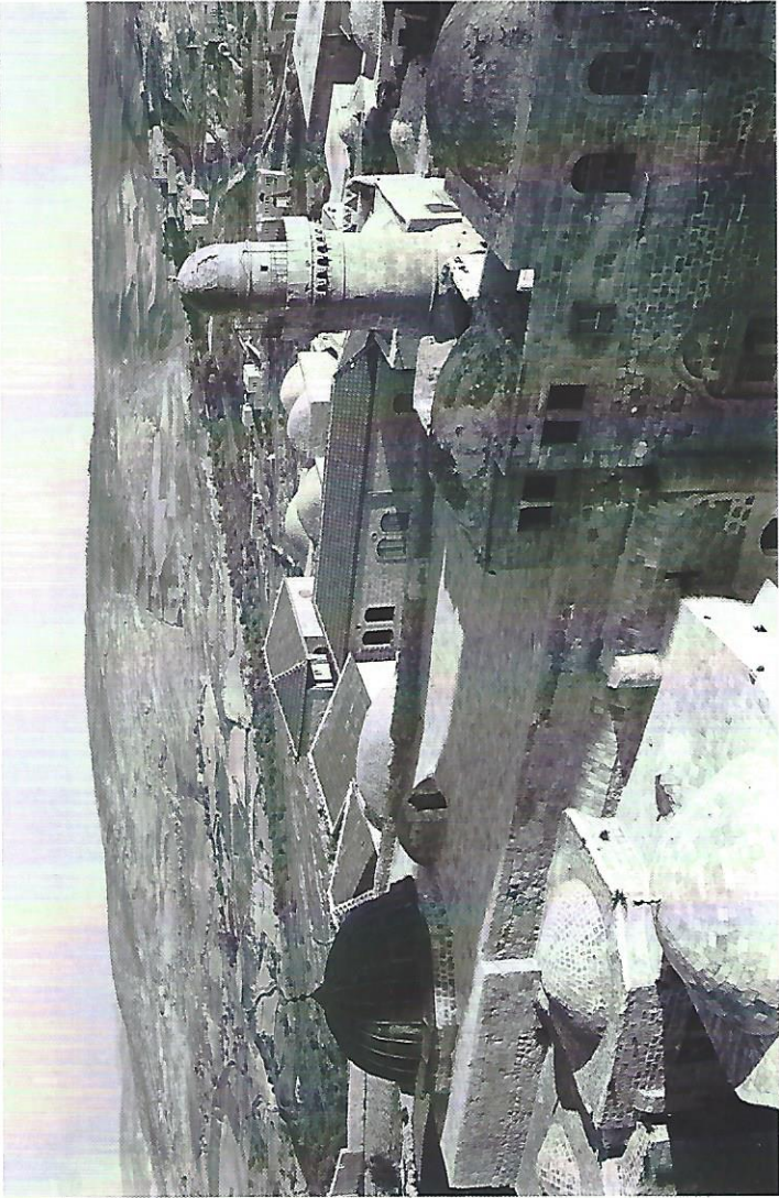
Du clocher de l'abbaye de la Dormition : Cénacle et le Tombeau de David, au mont Sion, Jérusalem. Vue vers le sud-est. Le cénacle dans la cour est au centre du cliché des Pères-Blancs de Sainte-Anne. Vers 1900.